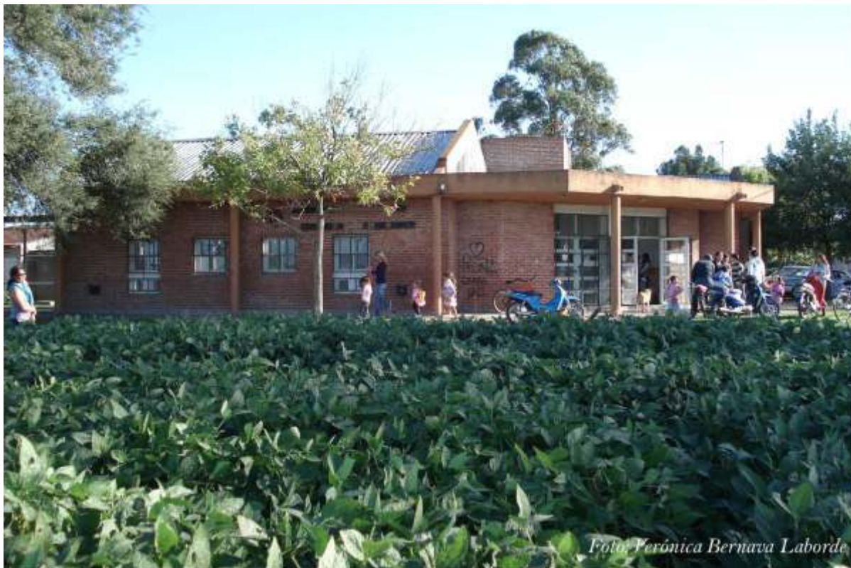
Escuela y soja. Cultivo de soja lindero a una institución educativa del Barrio 2 de Abril de la ciudad de Mar del Plata, año 2009.

Desde agosto de 2011 a noviembre de 2012 funcionó en el MGP una mesa multidisciplinaria de trabajo que contó con representantes de la FCEyN elegidos por el Consejo Académico. En el desarrollo de la mesa se planteó la factibilidad de aplicar, en la franja de restricción, modelos de producción agroecológicos como alternativa al tipo de producción actual, a través de las actividades que desarrollan investigadores del Instituto para la Agricultura Familiar (IPAF pampeana, INTA). Asimismo se trabajó para evitar la derogación de la ordenanza N°18.740/08, en consonancia con las declaraciones de la UNMdP. Finalizadas las reuniones, se suscitaron una serie de hechos políticos que incluyeron la reglamentación de la ordenanza, una audiencia pública y, finalmente, su derogación y sustitución por la N°21.296/13 (recuadro). Como estos hechos implican una regresión en los derechos ambientales adquiridos, la problemática fue judicializada. En este marco, autoridades de la FCEyN fueron convocadas por la Justicia para que expliquen los fundamentos y alcances de la declaración emitida por la Facultad en 2013.