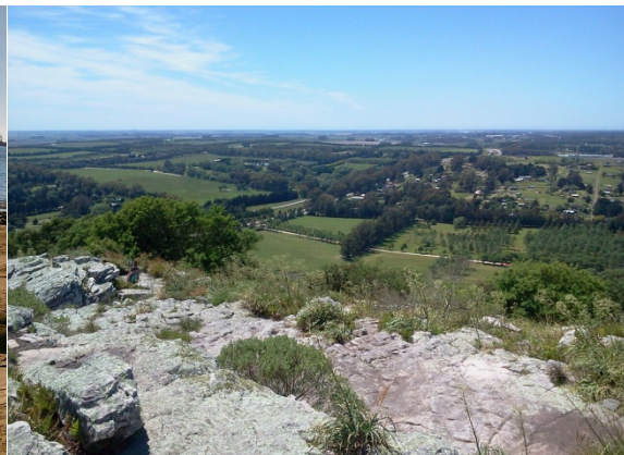
Sierras de Tandilia